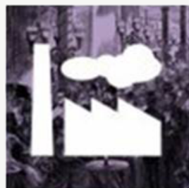
De tijd van Burgers en Stoommachines (1800 -1900)