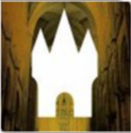
De tijd van steden en staten (1000 - 1500)