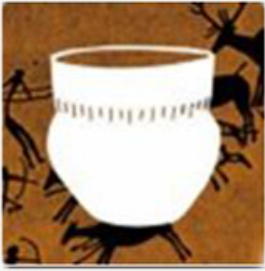
De tijd van jagers en boeren (tot 3000 v.Chr.)