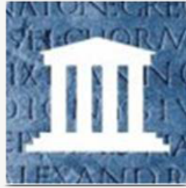
De tijd van Grieken en Romeinen (3000 v.Chr.- 500 n.Chr)