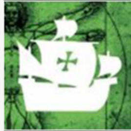
De tijd van Ontdekkers en Hervormers (1500 - 1600)