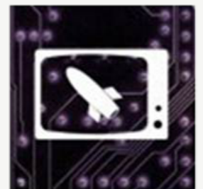
De tijd van de Televisie en Computer (vanaf 1950)